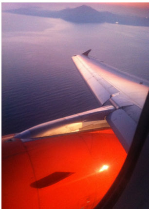
C'est le bronx dans la cour de l'immeuble d'Isabelle.