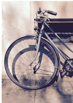
Le nouveau sac en croco d'Isabelle qui est fabriqué en Egypte.