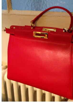
Isabelle part en vacances en Grèce.